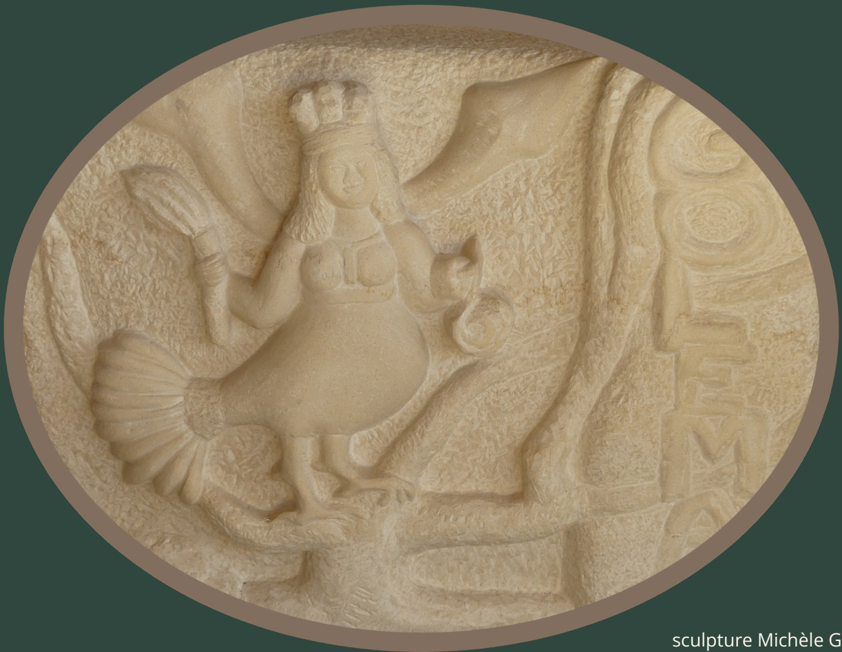
sculpture Michèle Gat

Sur un arbre perchée, portant d'une main fleur ou flamme, de l'autre le rouleau des connaissances, cette créature mi femme, mi oiseau appelle la question de nos dualités : joie et chagrin, prophétie et mystère, humain et bête. Quelle compréhension avons-nous de ce que signifie être puissant, être vulnérable, être humain ? L'association collégiale GOLEMA par ses créations collectives, ses pratiques artistiques croisées, ses parcours et explorations des coutumes ancestrales rassemble ce qui demande à être dit. Le collectage de paroles d'habitants de tout âge, le chant, la musique, la danse, expriment la recherche d'une certaine humanité en laquelle nous puissions nous reconnaître. C'est ainsi que sont créés avec les professionnels les spectacles, les ateliers, dans une pratique de création collective, d'une transmission intergénérationnelle avec participation de public amateur.